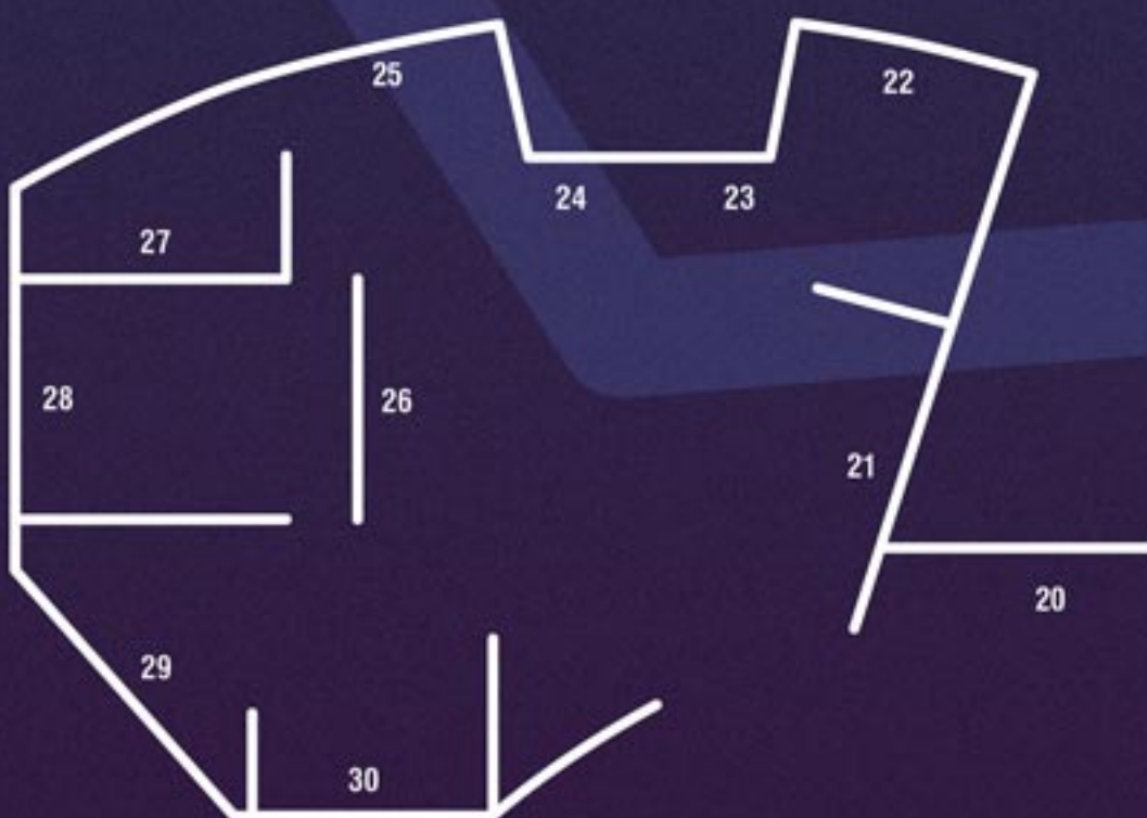
Rondo Sztuki Katowice Rondo im. Jerzego Ziętka 1